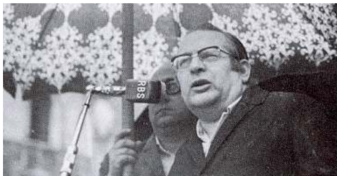
«La scena di orrore è davanti ai miei occhi». Le parole di Castrezzati