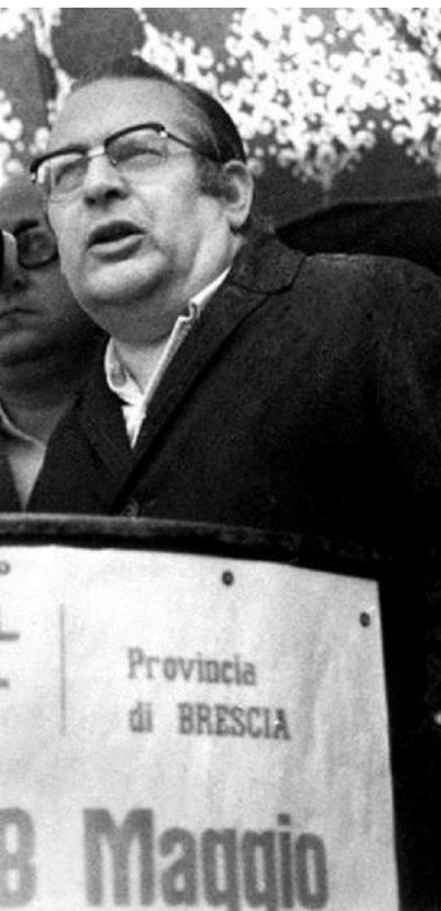
L'intervento Era il 28 maggio del 1974

servito senza servirsene - è il ricordo delle Acli bresciane - Da partigiano a sindacalista. Insieme a Pierre Carniti contribuì al rinnovamento della Federazione dei metalmeccanici e della Cisl con iniziative coraggiose mirate alla crescita del protagonismo dei lavoratori».