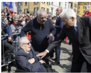
In piazza con il Presidente Mattarella

La vita di Franco Castrezzi è trascorsa in parallelo a quella della città: dalla strage fino all'ultimo giorno della sua esistenza una grande testimonianza di coraggio e di voglia di verità.