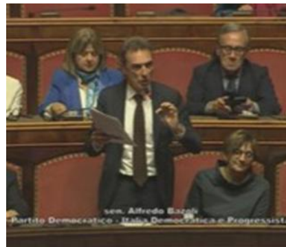
In aula il senatore Alfredo Bazoli tra i banchi del Senato

Fu proprio in quella veste - ha ricordato il senatore dem - che Castrezzi si trovò al centro di uno dei momenti più drammatici della storia della città e del Paese: la strage di Piazza della Loggia del 28 maggio 1974. «Era lui l'incaricato a prendere la