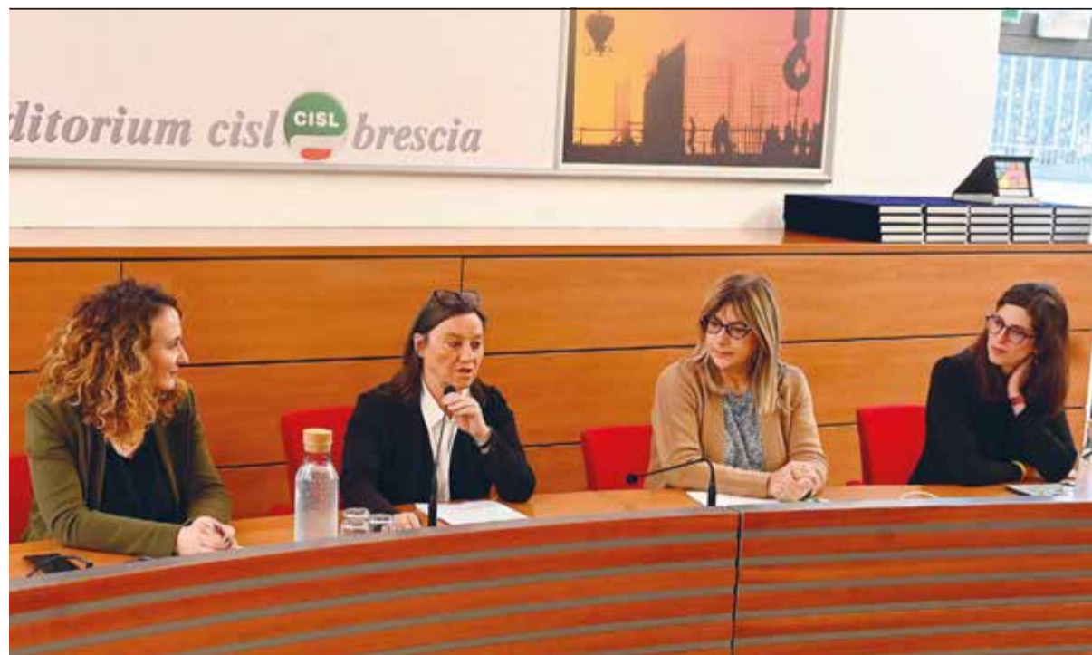
UN MOMENTO DEL CONVEGNO

Il tempo misurato in anni affinché l'impianto generi l'energia che è servita per produrlo