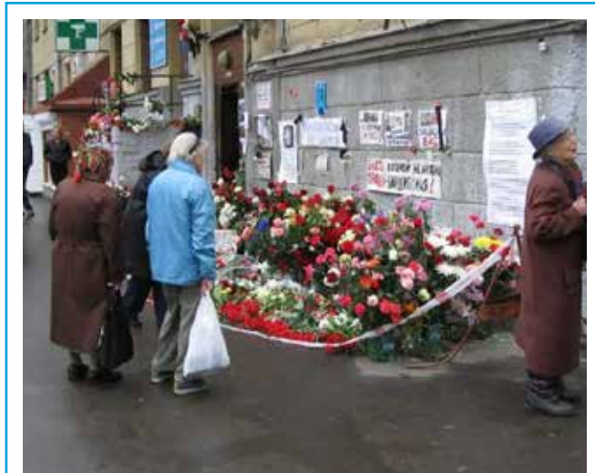
20 marzo 2023 | Promosso da Anteas, Auser e Pensionati Cisl e Cgil, è andata in scena al Piccolo Teatro Libero a Sanpolino, "Le voci di Anna", pièce in memoria della giornalista russa Anna Politkovskaja assassinata a Mosca il 7 ottobre 2006 (nella foto il luogo dell'agguato). Aveva denunciato le forze armate e i governi russi sotto la presidenza di Vladimir Putin per il mancato rispetto dei diritti civili e dello stato di diritto.