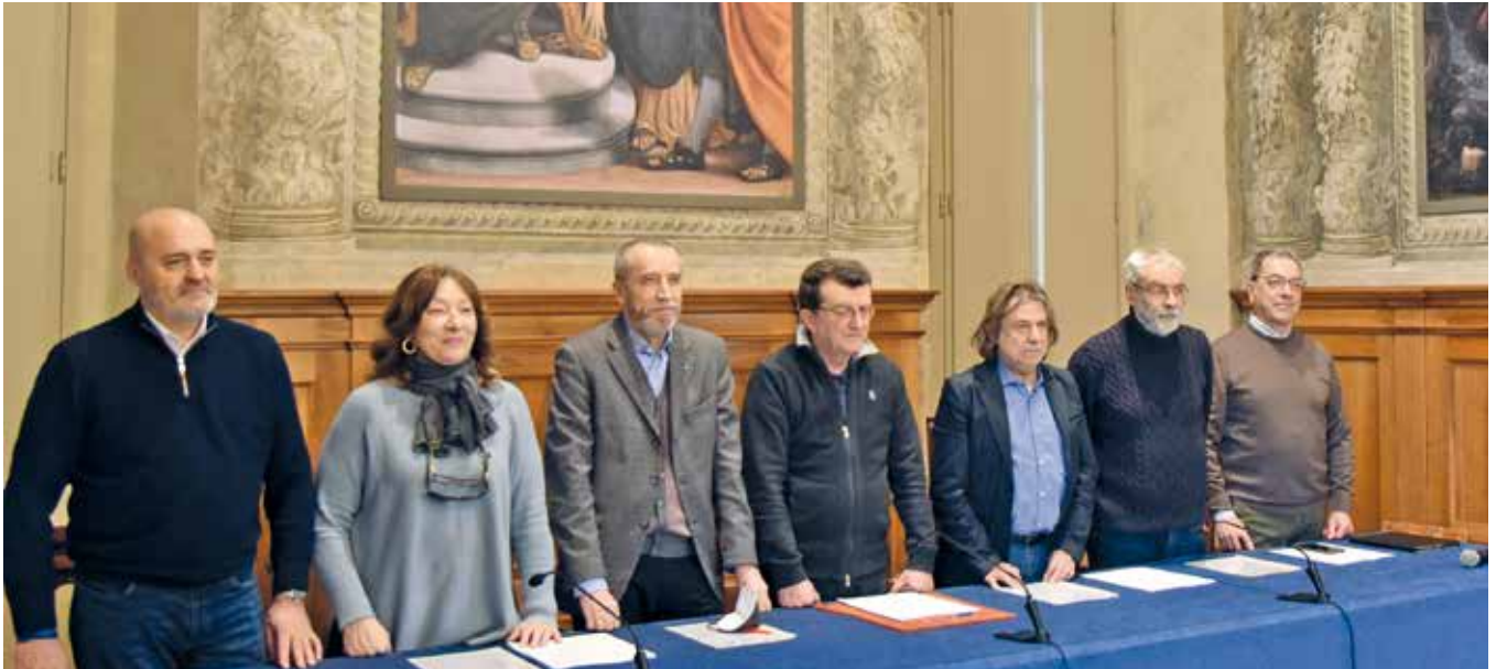
2 marzo 2023 | Firmato in Palazzo Loggia il Protocollo 2023 tra Comune di Brescia e Sindacati dei Pensionati. Leggi l'articolo a pag. 11.