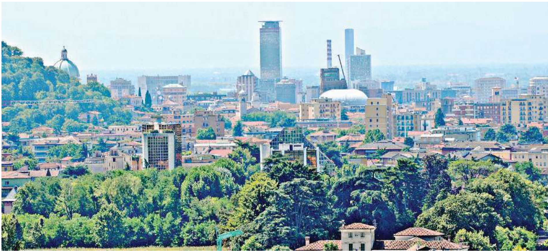
L'emergenza abitativa resta un problema sul tappeto del dibattito politico e sindacale, in particolare dopo il taglio dei contributi statali