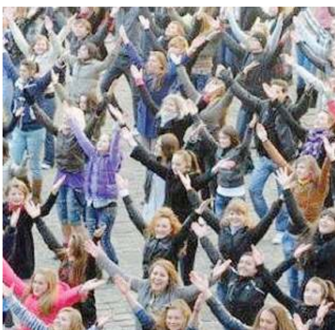
Un flash mob del V Day